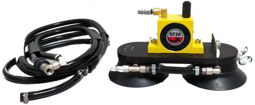
専用ホースセット